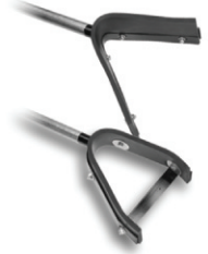
科来福 V 形橡胶刮平板 金属铝手柄 编号 27199

可以将修补机中熔化的宝利补材料装运到路面修补区进行施工。材料车有液化气加热装置和侧面出料控制杆。