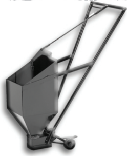
手推式灌缝罐 编号 40200

适用于使用标准密封胶灌注裂缝和接缝。滚轮设计，方便省力，自重给料并配有出料控制杆。