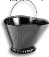
手提式材料桶 编号 32263