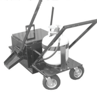
手推式材料车 编号 56375

可以将修补机中熔化的宝利补材料装运到路面修补区进行施工。材料车有液化气加热装置和侧面出料控制杆。